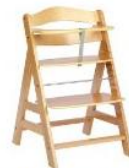
Hauck 662984 Hochstuhl Alpha natur EUR 49,90