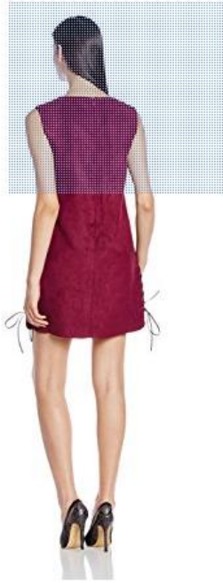
画像をクリックして拡大イメージを表示