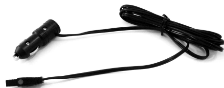
12V Power Cord Cordon d'alimentation 12V