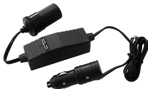
Battery Saver Économiseur de batterie