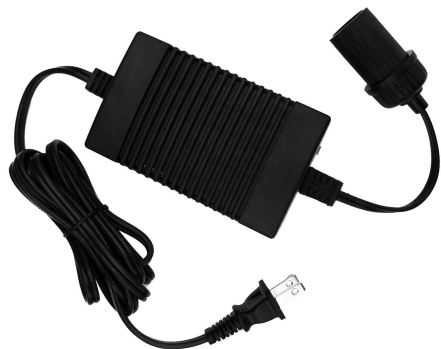
Power Adapter Adaptateur de courant

Pour les prix et disponibilités, veuillez composer le : 800 265-8456