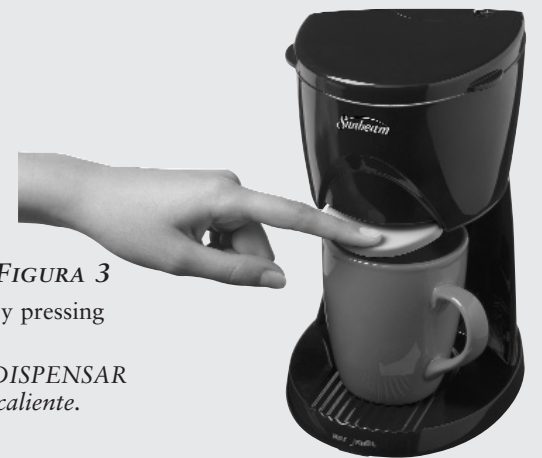
FIGURE 3 / FIGURA 3

Activate heating by pressing down on HEAT button. Presione el botón CALENTAR para comenzar a calentar.