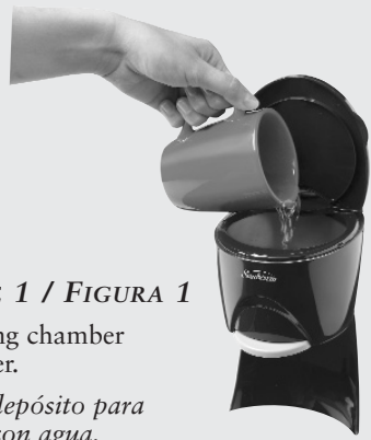
FIGURE 1 / FIGURA 1

Fill heating chamber with water. Llene el depósito para calentar con agua.